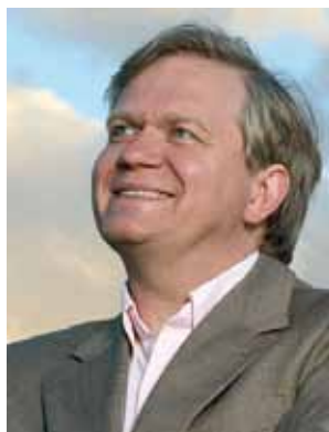
Brian P. Schmidt