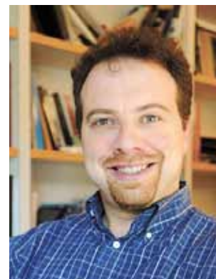
Adam G. Riess