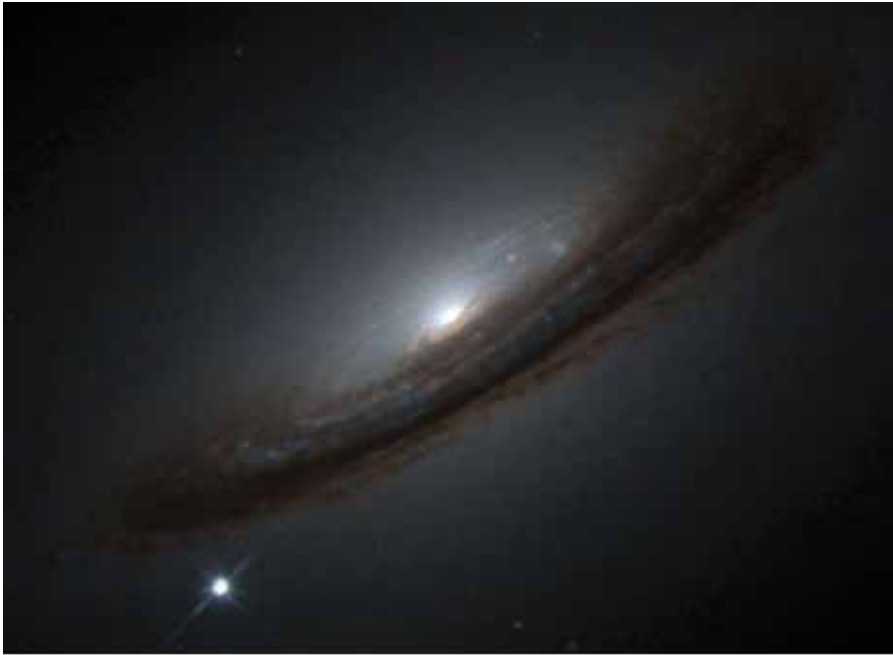
Fig. 1 La galassia NGC 4526, con la supernova SN1994D: nella sua fase di massimo la luminosità della stella in esplosione è confrontabile con la luminosità dell'intera galassia.