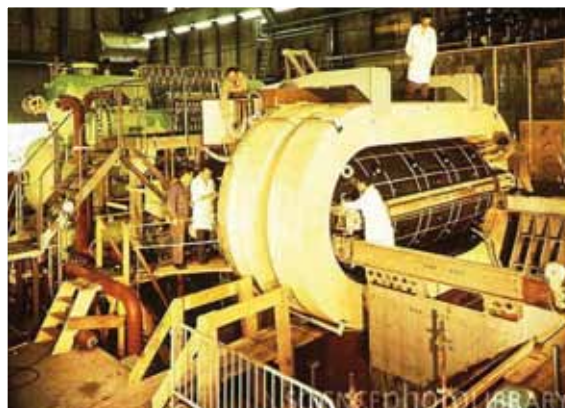
Fig. 1 The body of the Gargamelle chamber in its coils that generate the magnetic field.

The weak interaction is one of the fundamental forces between the elementary constituents of matter. Weak forces are responsible of the energy production in the Sun and, at microscopic scales, of the beta decays of nuclei and of elementary particles. For example, a neutron decays into a proton, an electron and an anti-electron-neutrino. In 1934 Fermi developed the first theory of weak interactions. In his theory, the neutron emits the electron-antineutrino pair, in analogy to the photon emission, by an atom or a nucleus, in electromagnetism. Differently from the photon, the lepton-antilepton pair carries electric charge (negative in the example, positive in other cases). In the evolution of the theory, the concept of “weak charged currents” (CC) was developed. The discovery of parity violation in 1957 led to establish the V-A character of the weak charged current: it contains a vector and an axial component of the same amplitude and opposite sign. A drawback of the V-A theory was the predicted divergence at high energy of the interaction strength and efforts were made by the theorists to develop, in analogy to QED, a gauge theory of weak interactions. Sheldon Glashow (1961), Abdus Salam (1968) and Steven Weinberg (1967) succeeded in building such a “unified” model of