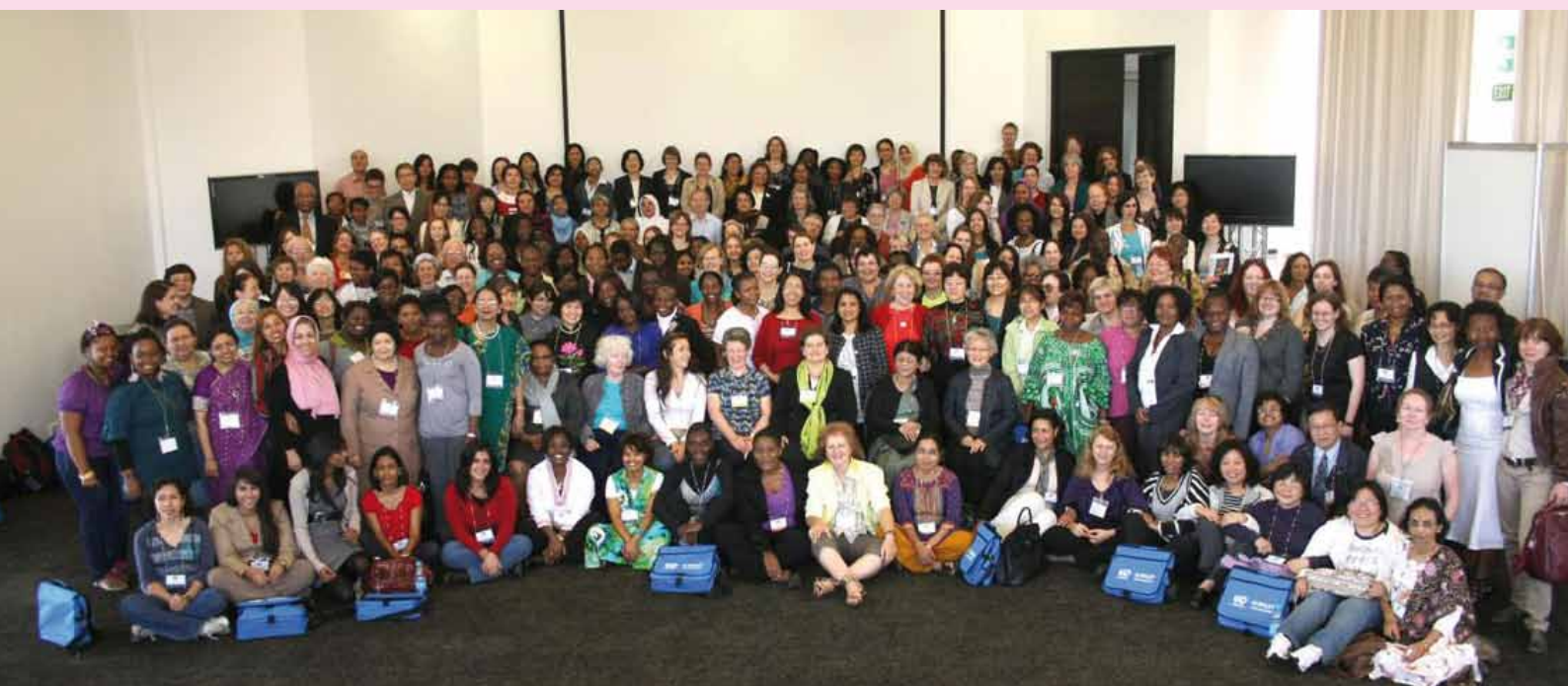
Fotogruppo dei partecipanti.

Pulsar; Archana Bhattacharyya [4], Direttore dell'Istituto Indiano di Geomagnetismo, ha parlato dei fenomeni meteorologici nella ionosfera equatoriale; Yanlai Yan [3] della Jiao Tong University (Cina) ha illustrato i segreti del suono delle antiche campane cinesi; Cecilia Jarlskog, Presidente eletto IUPAP (Svezia), ha mostrato i misteri della fisica delle particelle e Tebello Nyokong [5] (Sud Africa), vincitrice del premio l'Unesco-Oreal nel 2009, ha presentato la sua ricerca nel campo delle applicazioni biomediche sul tema: i laser e le ftalocianine nella terapia del cancro.