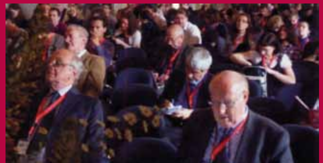
Fig. 1 The audience with wide-ranging ages during a scientific session.